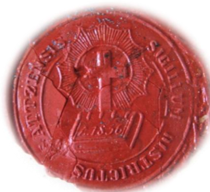
Obr. 3b – Pečať dekanátu Čadca z roku 1856