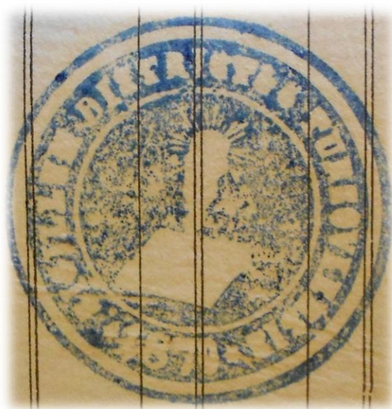
Obr. 2 – Atramentový odtlačok pečate turzovského dekanátu z roku 1883

Pečiatka, ktorú používal dekanát od roku 1923 sa od pôvodnej líšila. Pečať bola okrúhla s priemerom 36 mm. V pečatnom poli bola vyobrazená kniha, za ňou je kríž so svätožiarou. Kolopis je od pečatného poľa oddelený hladkou kružnicou. Znie: R. k. Dekanský úrad okresu Turzovského 1923 *. Zdá sa, že na hornej doske knihy bolo niečo napísané, ale z nekvalitného odtlačku nie je možné zistiť, o aký nápis išlo. Pečať s rovnakým obsahom používal aj dekanát Čadca (viď Obr. 3b). 15 Okrem pečate nepoužíval pôvodný turzovský dekanát nijaké ďalšie symboly.