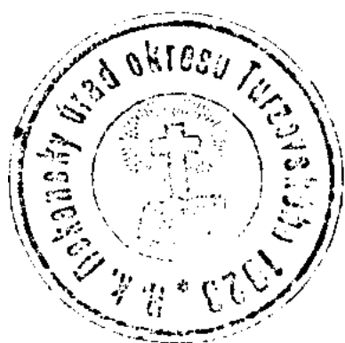
Obr. 3a – Pečiatka dekanátu z roku 1923

Pečiatka, ktorú používal dekanát od roku 1923 sa od pôvodnej líšila. Pečať bola okrúhla s priemerom 36 mm. V pečatnom poli bola vyobrazená kniha, za ňou je kríž so svätožiarou. Kolopis je od pečatného poľa oddelený hladkou kružnicou. Znie: R. k. Dekanský úrad okresu Turzovského 1923 *. Zdá sa, že na hornej doske knihy bolo niečo napísané, ale z nekvalitného odtlačku nie je možné zistiť, o aký nápis išlo. Pečať s rovnakým obsahom používal aj dekanát Čadca (viď Obr. 3b). 15 Okrem pečate nepoužíval pôvodný turzovský dekanát nijaké ďalšie symboly.